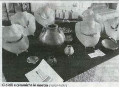
Gioielli e ceramiche in mostra